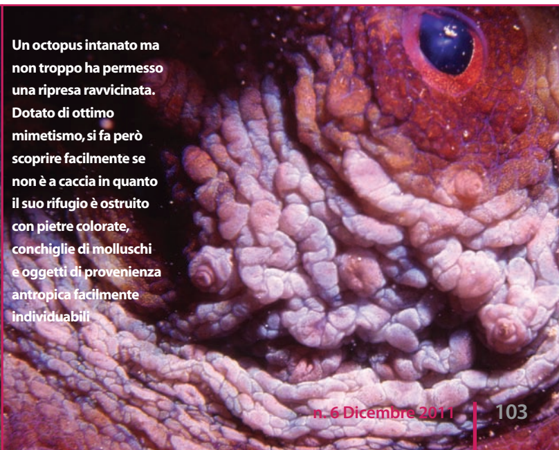
Un octopus intanato ma non troppo ha permesso una ripresa ravvicinata. Dotato di ottimo mimetismo, si fa però scoprire facilmente se non è a caccia in quanto il suo rifugio è ostruito con pietre colorate, conchiglie di molluschi e oggetti di provenienza antropica facilmente individuabili