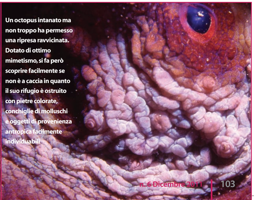
Un octopus intanato ma non troppo ha permesso una ripresa ravvicinata. Dotato di ottimo mimetismo, si fa però scoprire facilmente se non è a caccia in quanto il suo rifugio è ostruito con pietre colorate, conchiglie di molluschi e oggetti di provenienza antropica facilmente individuabili